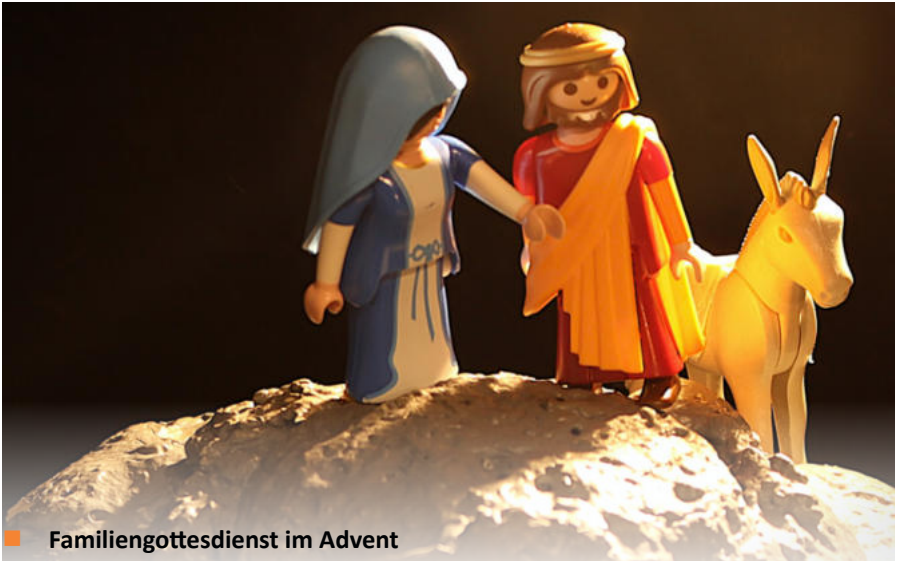
■ Familiengottesdienst im Advent

Gemeinsam machen wir uns mit Josef und Maria auf den weiten Weg. Lang ist diese Geschichte her und dennoch bewegt sie uns noch heute. Aber warum ist das so und was hat das, was die beiden erleben, mit unserem Leben zu tun?