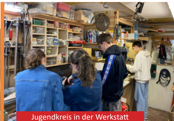
Jugendkreis in der Werkstatt